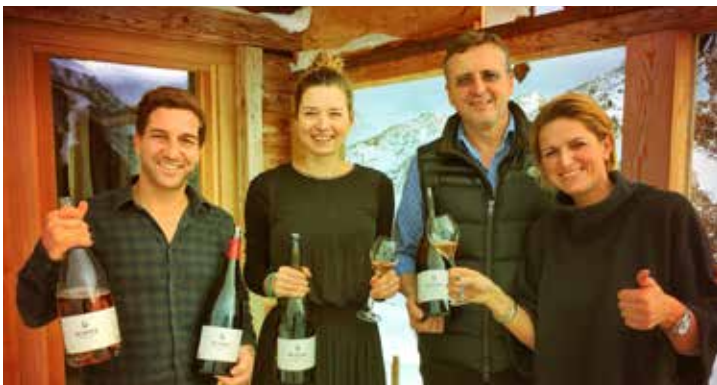
RENNER & rennersistas Gols, Burgenland