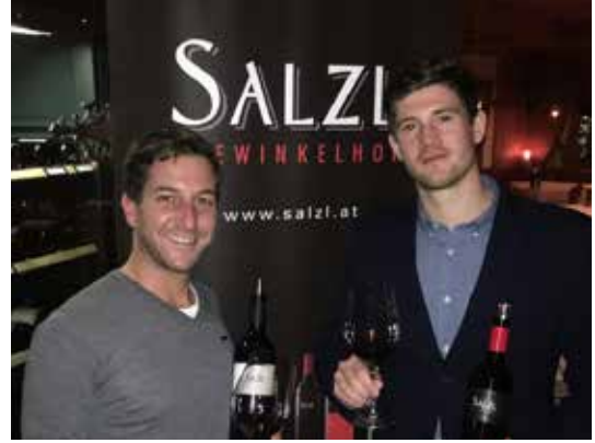
Weingut Salz Seewinkelhof, Illmitz, Burgenland

Außerdem besucht das Wedelhütten-Team jedes Jahr einige Weingüter und hält sich dabei ständig auf dem Laufenden.