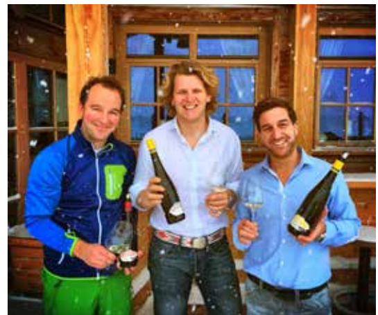
Weingut Michael Malat Kremstal, Niederösterreich