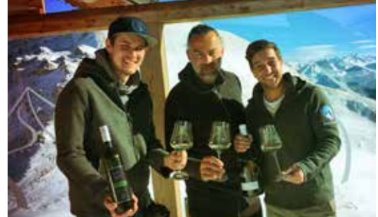
Weinmanufaktur Clemens Strobl Kirchberg am Wagram, Niederösterreich